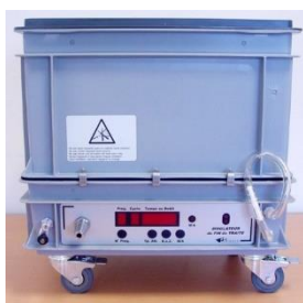
Simulateur de Fin de Traite (SFT)

Vignette apposée à l'issue d'un Dépos'Traite®