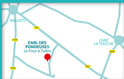
EARL des Pondeuses Le Four à Tuiles 53400 Livré-la-Touche